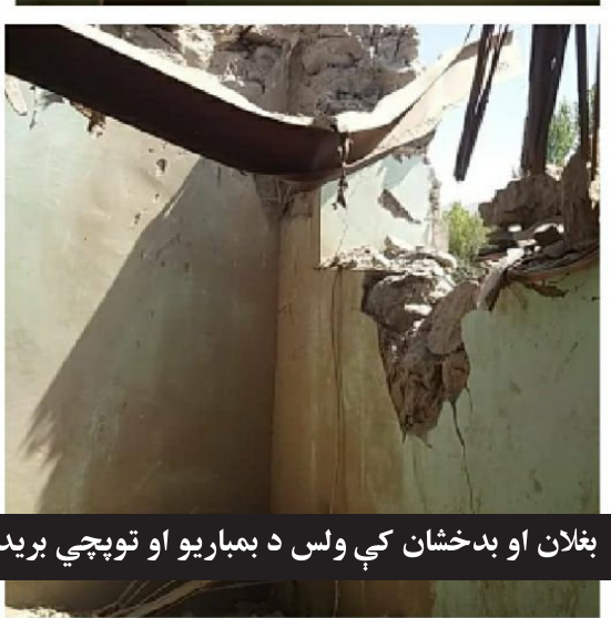
بنلان او بدخشان کې ولس د بمباریو او توپچي بریدونو له وجې د سترو زیانونو او جنایتونو شاهد دی!